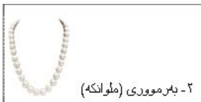
۲- به رمووری (ملوانکه)