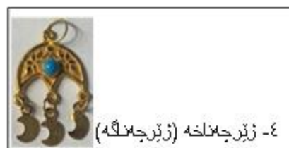
۴- زبیر چمانخه (زبیر چمانگه)