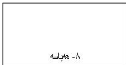
۸- هه یاسه