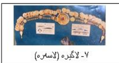
۷- لاگیره (لاسه ره)