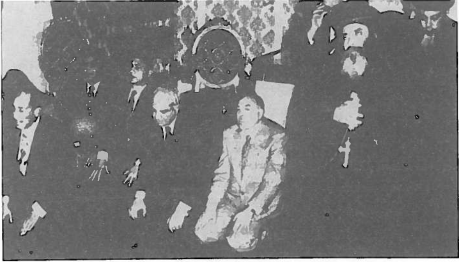
الرئيس السادات يؤم كبار رجال الدين والسياسة في المقر البابوي

وقد توازى حرص السادات على إذاعة صلواته مع تزايد حرصه على حضور المناسبات الدينية، وإلقائه خطبا فيها (٢١٢) . في هذه المناسبات كان يقدم خطابا ذا طابع ديني مهيمن. ويؤدى هذا من ثم إلى التماهى بين دورين اجتماعيين مختلفين؛ الأول دور رجل الدين، الذى يقوم خطيبا فى الناس فى هذه المناسبات، ودور رئيس الدولة. ويسهم هذا التماهى فى توجيه إدراك عامة الناس لرئيس الدولة، ليصبح الوجه الدينى محورا لهذا الإدراك.