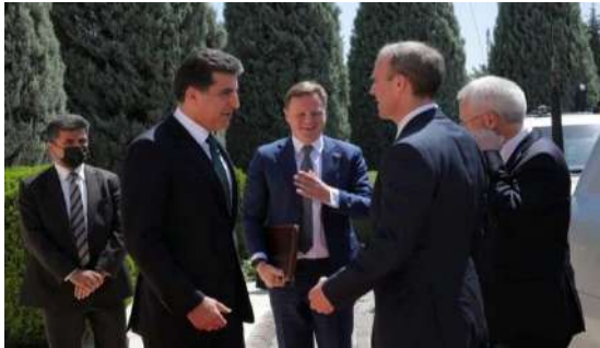
وینې ژماره (20) (دهمې پېښوازیې – بهری کومبونې)

شهنش: واتا و ناماژه‌بین دهر برینین سهروسیمایان ب گشتی: 1- سهروسیمایا نهرینی: ناسوده‌یی و هیمنی، وهکی دوینې (18، 19، 20، 21، 24) دا دیاردبیت: