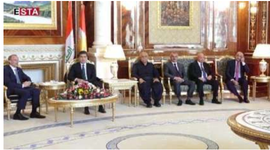
وینئ ژماره (26)

7- تیلکرنه دئیکدا و قوفلکرنا ئه‌وان، دلهر اوکئ و نه‌ئارامییئ، وه‌کی دوینئ (26) دا دیار: