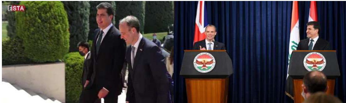
وینې ژماره (18) (دممې پښوازېبې – بهری کومبونې) وینې ژماره (24) (دممې پښوازېبې – بهری کومبونې)

حفت: واتا و ناماره‌یین راستگوبییبی ب ریکا زمانې له‌شی: 1- لیف ب شیوه‌یی قه‌کری مایه، وهکی د وینې (18، 24، 25) دا هاتیه نیشانان: