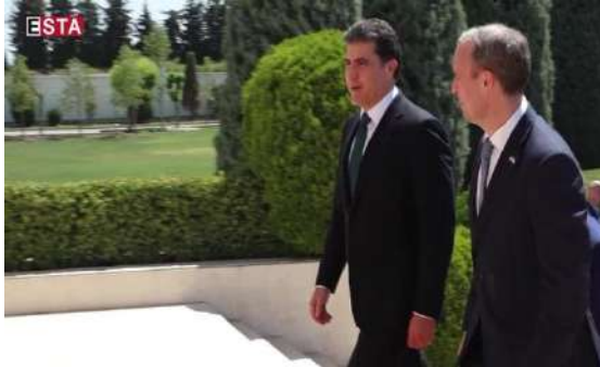
وينی ژماره (25)

چوار: واتا و ناماز هپين راستي و باوهریبي ب ريکا زماني لهشي: 1- شيوایي ب ريفه‌چوني: ب ريفه‌چون ب شيوه‌يي ريك و پيك و مل دلقيت و