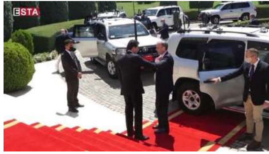
وینې ژماره (27) (دهمې پېښوازیې – بهری کومبونې)