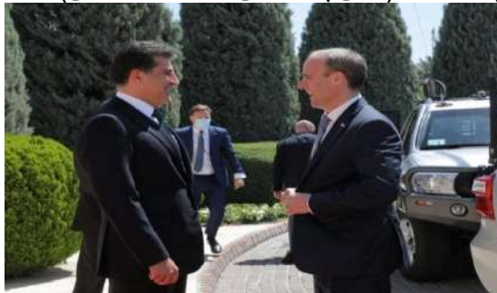
وینئ ژماره (21) (دهمئ پیشوازیی – بهری کومبونئ)