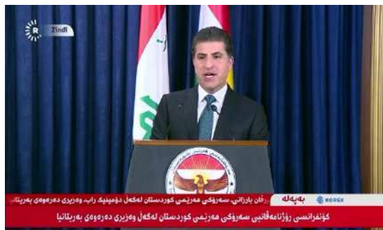
وینئ ژماره (2)

هەفت: واتا و ئاماژەین راستگوییی ب ریکا زمانی لەشی: دەمی لئف بمینتە فەکری، واتە کەسەکی راستە و راستە و راستگوییە ( Al Noaimi, 2020)، هەروەسا دەمی ئاخفتنکر یان گوتاریبێژ راستەوراست بەریخۆددهتە جەماوەری ل دەمی بەرسفدانی و