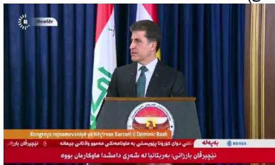
وینئ ژماره (8)

(دوماهییا دیدار و کۆمبونئ - کۆنفرانسا) (دوماهییا دیدار و کۆمبونئ - کۆنفرانسا روژنامەقانی)