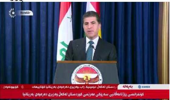
وینئ ژماره (3)

(دوماهییا دیدار و کۆمبونئ - کۆنفرانسا) (دوماهییا دیدار و کۆمبونئ - کۆنفرانسا روژنامەقانی)