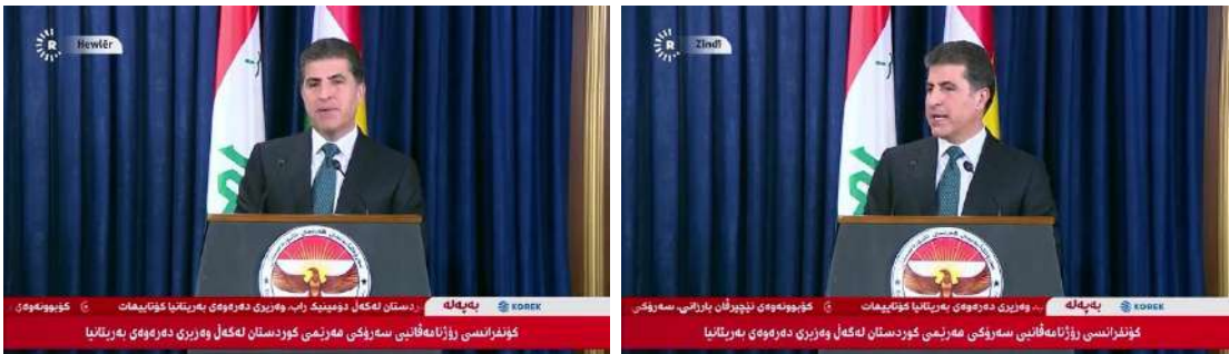
وینئێ ژمارە (9)

3- بارین فیسئۆلۆجییی وەکی سۆربونا روخساری، هەروەکی د وینئێ (1) و (9) و (10) هاتیە نیشاندان: