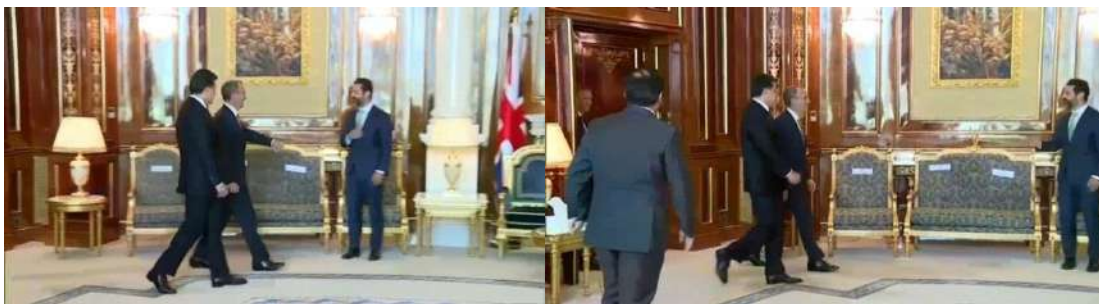
وینئ ژماره (16)

8- لئینن زیده ل ده‌مه‌کئ کورتدا، ئه‌ف چهنده ل ده‌ف ناڤیری ل ده‌مئ روینشتن و بریقه‌چونئ و کۆنگره‌یا روژنامه‌فانیدا دیار دبیت، کو واتایا نه‌ئارامی و دلهر اوکئیی ددهت. 9- بریقه‌چون، بریقه‌چونا بلمز و پینگاڤین دریز، واتایا دلهر اوکئ و نه‌ئاسوده‌ییی ددهت، وه‌کی د وینئ (15) دا دیار دبیت: و (16)