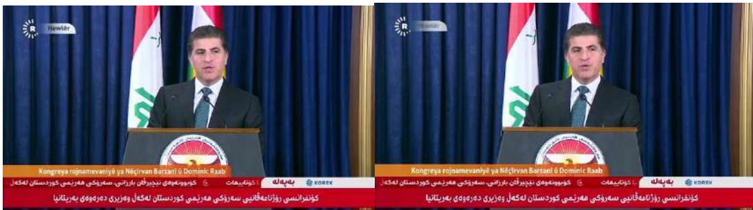
وینی ژماره (5)

دو: واتا و ناماژەیین سەرسامبوونی ب رێکا زمانئ لەشی: برنا سەری بۆ پرمخەکی واتایا سەرسامبوون و گرنگییا بابەتییه، وەکی دوینی (4) و (5) و (6) و (7) و (17) دا دیاردییت: