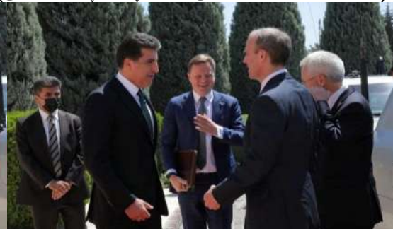
وینئ ژماره (20) (دهمئ پیشوازیی – بهری کومبونئ)

راسته‌قینه، وه‌کی دوینئ (19) و (20) و (21) دا دیار دبیت: