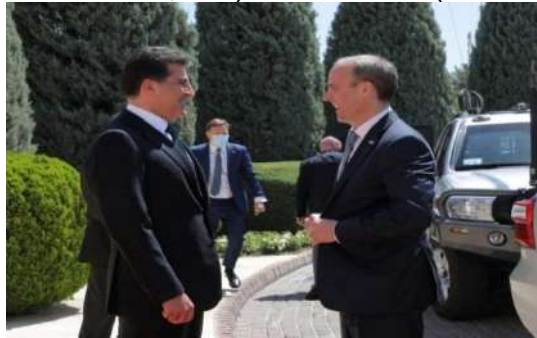
وینن ژماره (21)