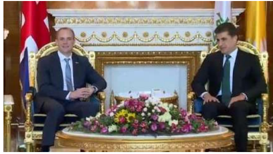
وینئ ژماره (14)

6- جوتبونا پینان و خو کۆمکرن، واتایا نه‌ئاسوده‌ییی ددهت، وه‌کی د وینئ (14) دا دیار: