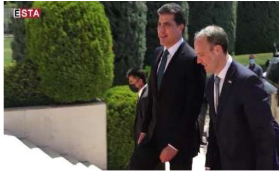
وینې ژماره (24) (دممې پښوازېبې – بهری کومبونې)

2- سروسیمایا نه‌رینې، وهکی سوربونا سروسیمایان و گرژبونا ناقچاقان و نیزیکبونا جه‌مسری ب نیکگه‌هشتنا هردو برییان، نه‌اسوده‌یی و دل‌پراوکی و خه‌مگینیبی دگه‌هینیت، د نامارا خالا (نیک) ییا نه‌قی قه‌کولینیدا دگل ریژه‌یا بکارهینانا نه‌وان هاتینه نیشانان: