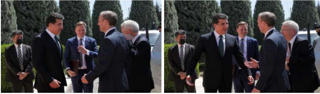
وینن ژماره (20) (دهمئ پینشو‌ازیی - به‌ری کۆمبونئ)

2- به‌ریخو‌دانا راسته‌موخویا به‌رامبه‌ری، هه‌رومکی د وینن (20، 19، 21) دا هاتیه: