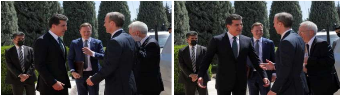
وینن ژماره (20) (دهمئ پینشو‌ازیی - به‌ری کۆمبونئ)

3- فه‌کرنا ده‌ستان ل ده‌مئ راوه‌ستیان و روینشتننیدا، ومکی د وینن ( 19، 20، 28، 29) دا دیار: