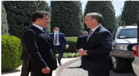
وینې ژماره (21) (دهمې پېښوازیې – بهری کومبونې)