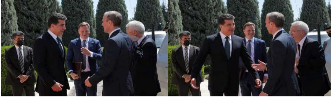
وینن ژماره (20) (دممې پښوازییې - بېری کومبونئ)