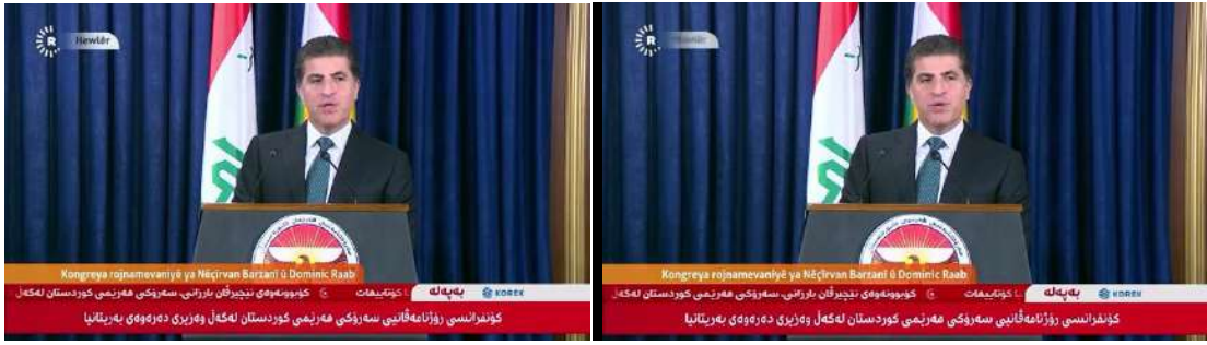
وینئێ ژمارە (5)