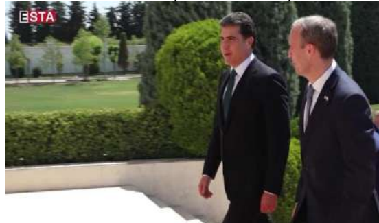
وینې ژماره (25) (دممې پښوازېبې – بهری کومبونې)