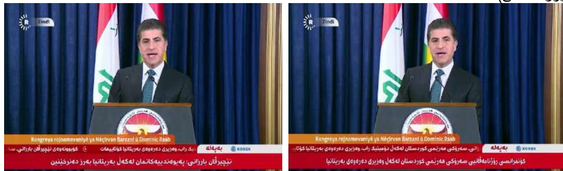
وینی ژماره (7)

(دوماهییا دیدار و کۆمبوونی – کۆنفرانسا رۆژنامەفانی) (دوماهییا دیدار و کۆمبوونی – کۆنفرانسا رۆژنامەفانی)