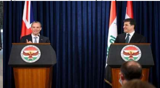
وینې ژماره (18) (دهمې پېښوازیې – بهری کومبونې)