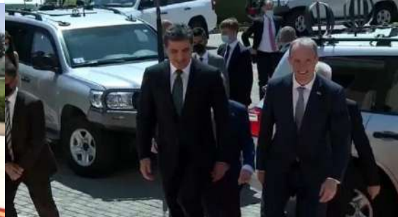
وینن ژماره (22) (دممې پښوازییې - بېری کومبونئ)