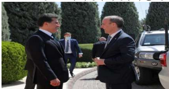
وينی ژماره (21)

پينج: واتا گرنگيپيدان و گهرم و گوريي: نيرينا چاقان ب شيوه‌يهکي راسته‌وخو و ب روخساره‌کا ناسايي و نمريني، وهکي د وينی (20) و (21) و (27) دا ديار دبیت: