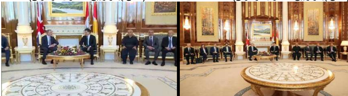
وینن ژماره (29) (دهمئ دیدار و کۆمبونئ)