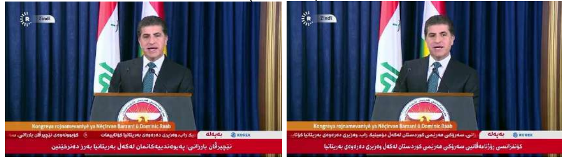
وینئێ ژمارە (7)

(دوماهییا دیدار و کۆمیونئ – کۆنفرانسا رۆژنامەقانی) (دوماهییا دیدار و کۆمیونئ – کۆنفرانسا رۆژنامەقانی)