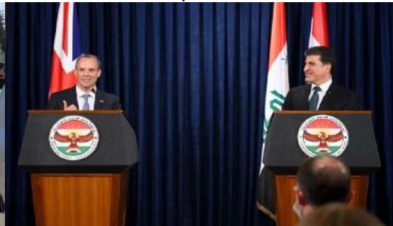
وینئ ژماره (18) (دوماهیا دیدار و کومبونئ – کونفرانسا روژنامه‌قانی)