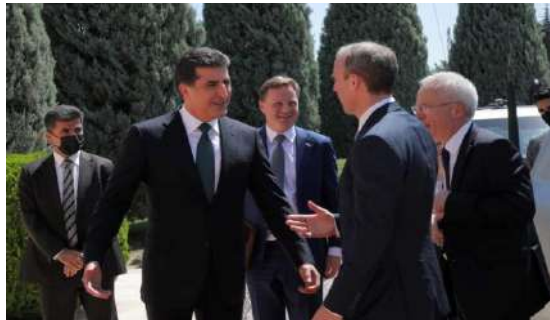
وینئ ژماره (19) (دهمئ پیشوازیی – بهری کومبونئ)

سئ: واتایا ئاسوده‌یی (ئارامی) و بهیژیی ب ریکا زمانئ له‌شی: 1- چاف و لینیترین: چاف و لینیترینه‌کا گه‌ش و ب گرنزینه‌کا راسته‌قینه، وه‌کی