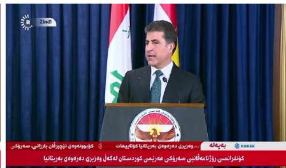
وینئ ژماره (1)

(دوماهییا دیدار و کۆمبونئ - کۆنفرانسا) (دوماهییا دیدار و کۆمبونئ - کۆنفرانسا روژنامەقانی)