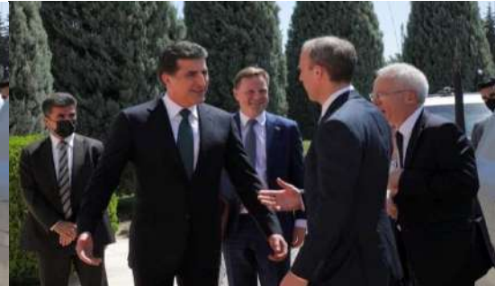
وینې ژماره (19) (دهمې پېښوازیې – بهری کومبونې)