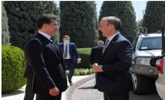
وينی ژماره (21)

2- بلنډکرن دفن و نمرزنگي: وهکي دويني (18) و (21) دا ديار دبیت: