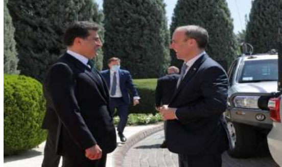
وینن ژماره (21) (دممې پښوازییې - بېری کومبونئ)

دیسان بریفه‌چونا هینم و پښگاف کورت، وهکی دویننئ (22) و (23) دا هاتیبه نیشاندان: