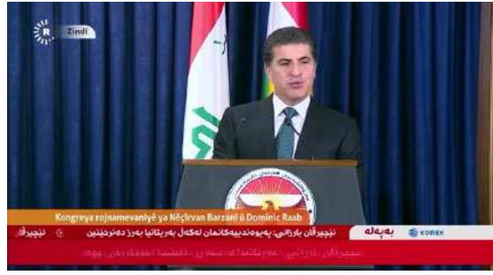
وینئ ژماره (17) (دوماهیا دیدار و کومبونئ – کونفرانسا روژنامه‌قانی)