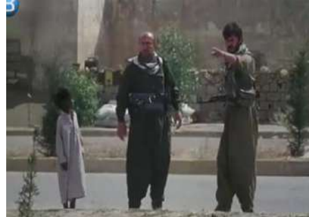
وينه ي ژماره (8): گرتە يا نافنجى، دياركرنا لقينان

3- لقين و نامارهبين له شى وه كو ده ست و پينان دياردكهت.