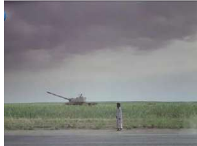
وينه ي ژماره (36): رهنگ، دراماتيكي