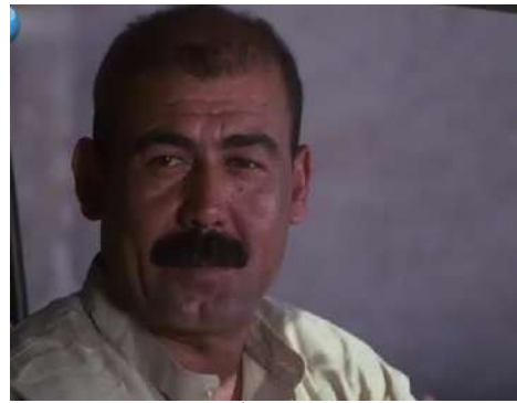
وئىنەي ژمارە (13): گرتەيا نىزىك، دەرپىن

كامېرە ژ دىكۆرى يان بابەتى وئىنە كرى بلندترە بۇ كەسى. ئانكو ژ بلنداھىيى بەرى خۇ ددەتە تىشتى وئىنە كرى بۇ بچويىككرا قەبارى تىشتى ژ يى سىرۇشتى و دياركرا ئەوى د ھەلوپىستە كى لاوازدا(شاوش، 2008: 93).