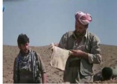
وينه ي ژماره (34): رهنگ، سه رنجا كيشاني