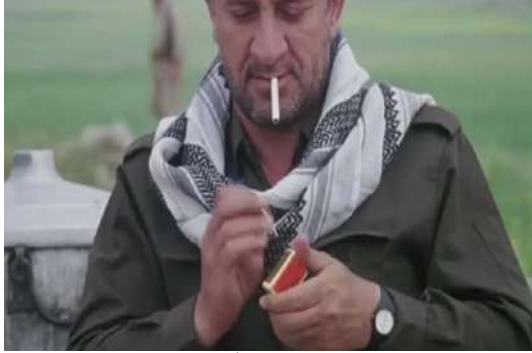
وينه ي ژماره (10) گرتە يا نيزيك وينه ي ژماره (11) گرتە يا نيزيك

گرتە يا نيزيك ديبته هئما و د شياندايه بهيته خواندن ب شيوه كئ سيمبوتيكى بؤ گه هشتى ب واتاين جياواز. بؤ دهربرينى ژ ناخ و نافه روكا كه سايه تيان دهيته بكارهينان. گرتە يا كه دهلاله تا دهر وونيه چونكو سه رنجى رادكيشيت ب رپكا مەزكنا تىشتى (جاسم. 2018. 215). ديتنى بؤ تىشته كئ ده ستنيشانكرى رادكيشيت ب رپكا جه ختكرنى ل سهر هندەك تىشتين ده ستنيشانكرى. ههروه سا كارقه دان و دهربرينى ديمى كه سايه تيان ب شيوه كئ روون دياردكهت (الحديدي وامام، 2002: 84). د (فيلمى دهر بيازبوون ژ غوبارى) دا گرتە يا نيزيك بؤ چه ند مه رمه كان بكارهاتيه، ژ نه وان: 1- ديالوگ: ب تايبهت ل ده مى سينگ و مل و سهر دهينه دياركرن. بؤ نمونه: