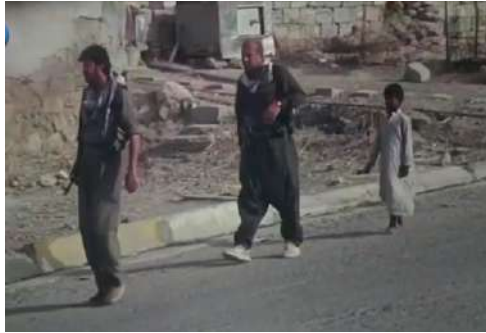
وينه پي ژماره (5): گرته يا نافنجي

تهف گرته يه دشيت ب ئاساني سي ته کتيران د ئيک وينه دا بخوڤه بگريت. که سايه تي د ناف چارچو وڤه پي وينه دا دهرده کفيت. ئانکو هه مي له شي ئه وان دهرده کفيت و دويڤچوونا لفينين ئه وان ده پته کرن ژ سهرى تاکو پييان. لفينين که سايه تيان و کريارين ئه وان بؤ بينه ري ديار دکه ت ل گهل فهرامؤشکرنا ده وروبه ري گشتي ئه وي رويدان لي پهيادابن (محمد، 2018: 157). بؤ نمونه: