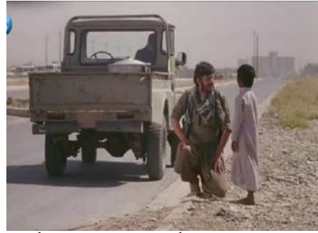
وينه ي ژماره (7): گرتە يا نافنجى، ديالوگ

2- دهربرين: ب تايبهت ل ده مى مل و سهر بتنى دهينه دياركرن.