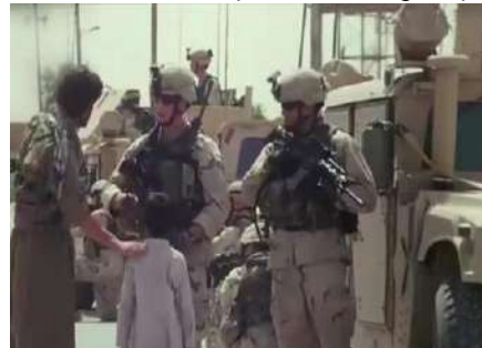
وينه ي ژماره (9): گرتە يا نه مريكى

4- ژ لايه كئ ديقه بؤ فه گوهاستنى ژ گرتە يا گشتى بؤ يا نيزيك دهيته بكارهينان. ئيك ژ گرتە يين دى كو شيوه ي نه وى نيزيكى نه فى جوربيه؛ گرتە يا نه مريكيه، كو كه سايه تيان ژ سهرى تاكو سه رچوكان وينه دكهت. مه رهم زئى دياركرنا هه مى لقين و كيرارين نه كته ريبه (فينتورا، 2012: 50).