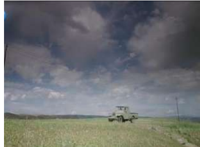
وينه ي ژماره (35): رهنگ، جوانكارى