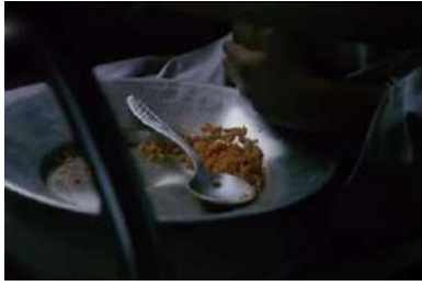
ويتنه ي ژماره (33): رووناھي، دياركرنا روون و ئاشكرا

4- بهرجسته كرنا رووناھي بؤ زېده كرنا ههستي بېدهنگي و ناراميي يان بهرؤقازي بؤ پيداكرنا نازراندن و نه ناراميي.