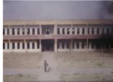
وينه پي ژماره (1): گرته يا گشتي

د فيلمي (ده ريازبوون ژ غوباري) دا مفا ژ ئه في گرته پي هاتيه وه رگرتن و چند جاره کان هاتيه بکارهينان. بؤ نمونه: