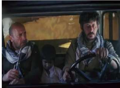
ويتنه ي ژماره (31): رووناھي، هه ست ديرووي