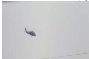
وينه يي ژماره (40): كاريگه ريپن دهنكي

د شيانا ئەويدا هه يه وه كو شيوه يه ك ژ شيوه يپن دهنكي كو ژ ژئدهركي په يدا ببيت، به لي دببت ئەوه ژئدهر ل سه ر شاشه يي دهريكه فيت يان ده رنه كه فيت. ئانكو نه مه رجه ئەم ژئدهري دهنگي ببينين، به لي يا پئدي قيه ئەم بزاني كو ژئدهره ك بو دهنكي هه يه (ديك، 2015: 65)، وه كو: دهنكي فروكه يان، تهقه مه نيي، ترومبيلان ... هتد. ئانكو دببت دهنك يي دهستكرد بيت يان يي سرؤشتي بيت، هه ره و سا دببت ئەم ژئدهري دهنكي ببينين يان نه ببينين.