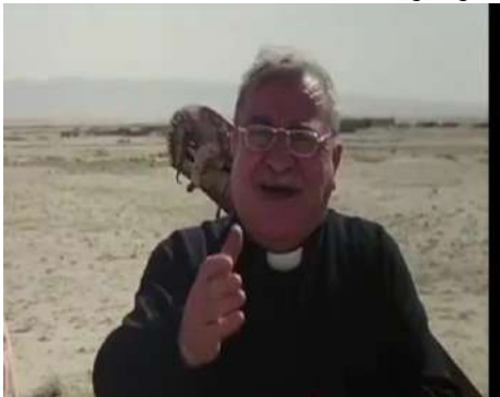
وينه ي ژماره (12): گرتە يا نيزيك، ديالوگ

گرتە يا نيزيك ديبته هئما و د شياندايه بهيته خواندن ب شيوه كئ سيمبوتيكى بؤ گه هشتى ب واتاين جياواز. بؤ دهربرينى ژ ناخ و نافه روكا كه سايه تيان دهيته بكارهينان. گرتە يا كه دهلاله تا دهر وونيه چونكو سه رنجى رادكيشيت ب رپكا مەزكنا تىشتى (جاسم. 2018. 215). ديتنى بؤ تىشته كئ ده ستنيشانكرى رادكيشيت ب رپكا جه ختكرنى ل سهر هندەك تىشتين ده ستنيشانكرى. ههروه سا كارقه دان و دهربرينى ديمى كه سايه تيان ب شيوه كئ روون دياردكهت (الحديدي وامام، 2002: 84). د (فيلمى دهر بيازبوون ژ غوبارى) دا گرتە يا نيزيك بؤ چه ند مه رمه كان بكارهاتيه، ژ نه وان: 1- ديالوگ: ب تايبهت ل ده مى سينگ و مل و سهر دهينه دياركرن. بؤ نمونه: