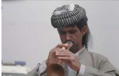
وينه ي ژماره (37)، موزيك نافخوي

1- موزيك نافخوي: نهو موزيكه نهوا ژ ژيده ره كي ناماده د ديمه نيذا په يدا د بيت.