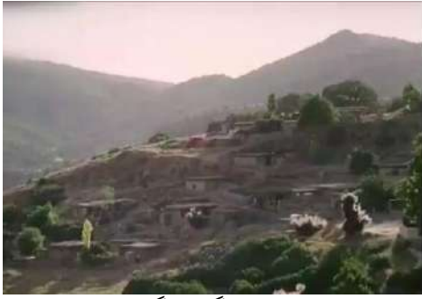
وينه پي ژماره (4): گرته يا گشتي، ديتنا سهره پاي