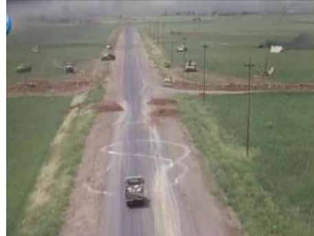
وينه پي ژماره (3): گرته يا گشتي، ديارکرنا جه ي

2- ديارکرنا جه ي گشتي پي رويدانين فيلمي.