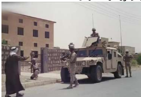
وينه پي ژماره (6): گرته يا نافنجي، ناساندا

تهف گرته يه پتر بؤ نياسينا که سايه تيان ده پته بکارهينان، ب تايهت ل ده مي ديا لؤگي. د شياندايه ئه رکين ئه في گرته پي د ئه في فيلميدا دياربکهين، کو: 1- که سايه تيان دده ته نياسين ههروه سا پيه ونديان د نافبه را دیکوري و که سايه تياندا ئافادکته.