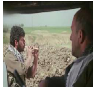
وينه يي ژماره (39): موزيك، دراما يي

2- گه لهك كؤد د زماني سينه ما ييدا بكاردهين، ژ ئەوان: كؤدين ته كنيكي، كو پيكا تينه ژ: كاميره (جورين گرته يان، گوشه يپن وينه كرني، لفيني، كاميره يي)، روونا هي، رهنگ، موزيك و كاريگه ريپن دهنكي.