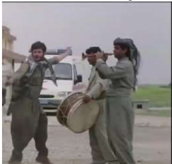
وينه ي ژماره (38): موزيك، ناماژه كرني

1- نهركي ناماژه كرني: موزيك شيايه ناماژه ي بده ته جهي رويدان لي په يدا بووين. چونكو هه وه لات و جهه كي موزيكه كا تايبه ت بخوفه هه يه.