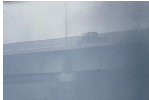
وينه پي ژماره (2): گرته يا گشتي، وه سفکرنا

ب شيويه پي گشتي گرته يه کا وه سفی و دامه زرينه ره، ئامازه پي دده ته کهش و سه قايي گشتي پي جه ي يان ده فه ري کو هه مي سيمايين جه ي تيدا دياردبن. ههروه سا ل دويڤچوونا لفينان د ناف کادريدا و زانينا پيه ونديا د نافبه را تشتاندا دکه ت ئه في گرته پي چند ئه رکه ک د ئه في فيلميدا ديتينه، ژ ئه وان: 1- وه سفکرنا گشتي بؤ فيلمي.