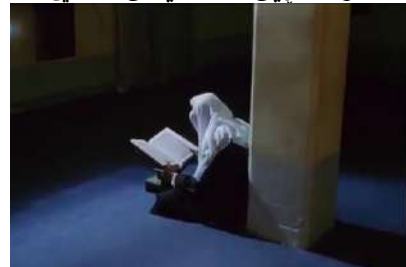
ويتنه ي ژماره (32): رووناھي، هه لويستي دراماي

ل ئه فؤري ژ رووناھيي ديار دبېت كو مه لا بتني يي د بهر ژ وهنديا خو دا.