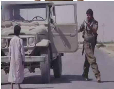
وئىنەي ژمارە (15): گۆشەيا ئاساي

ئەڧى گۆشەيى د ئەڧى فىلميدا چەند بكارھىنانەك ھەبووينە، ژ ئەوان: