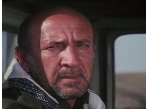
وئىنەي ژمارە (14): گرتەيا نىزىك، سۆزدارى

3- ھىشارى و سۆزدارى: كو بتى دىمى ئەكتەرى دەھىتە وئىنە كرىن. دىبىتە جھى سەرەنجى ب رىكا جەختى ل سەر لايەنن ھوير.