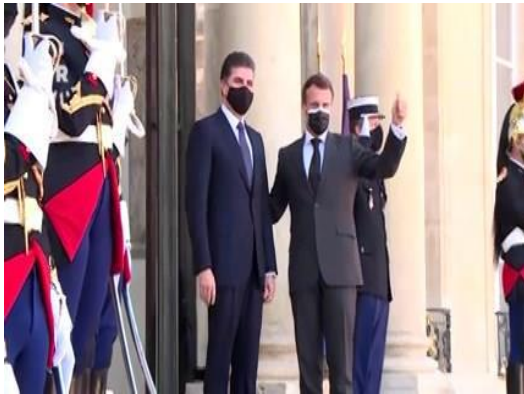
وينى ژماره (8)

٦- فهكرنا دهستان ل دهمى راوهستانى و برپقه چونى: ب گشتى د ئهقى پيشوازى و هه قديتنيدا، سهروكى ههريما كوردستانى و سهروكى فهريسا دهستى ههردوكان فهكريبه، ئهقه د زمانى لهشيدا