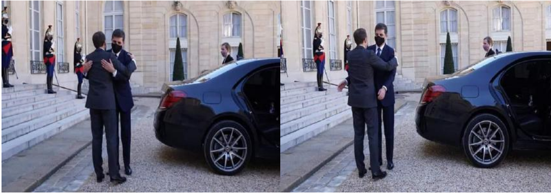
وینی ژماره (7) (دەمی خاتەر خواستنی)

هه قالینی و گرنگیدانا ئەوان ب ئیک و دو دەت، کو دو کەسین نیزیکن و پزیزگرتنه کا تایبەت ل دەق ئیک و دو هەنە و گەلەک پەرۆشن بۆ ئیک و دو.