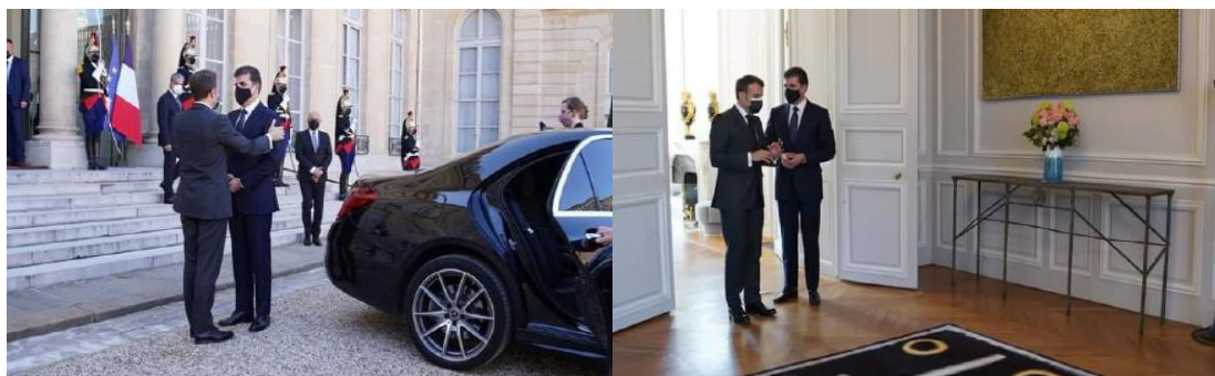
وینی ژماره (5)

10- ئاراسته و پێکییا مل و سه‌ری ل ده‌می پاوه‌ستیان و بپێڤه‌چونی: د ئه‌ڤی دیداریدا سه‌رۆکی هه‌رێما کوردستانی ل ده‌می پاوه‌ستیانی ب شێوه‌یه‌کی سه‌رنجراکیش و پێک ئاراسته‌یا سه‌ری بکارده‌هینیت و راسته‌وخۆ ب ئاراسته‌یا سه‌رۆکی فه‌ره‌نسا بپێیه‌ کو ب گشتی واتایا ئه‌رینی و گرنگبێدان و راستگۆیی و باوه‌رییه‌ و هه‌ردو مل ژێ ب شێوه‌یه‌کی ئه‌ندازه‌یی و هه‌ڤسه‌نگن دیسان ئه‌ڤه‌ چهنده‌ ژێ