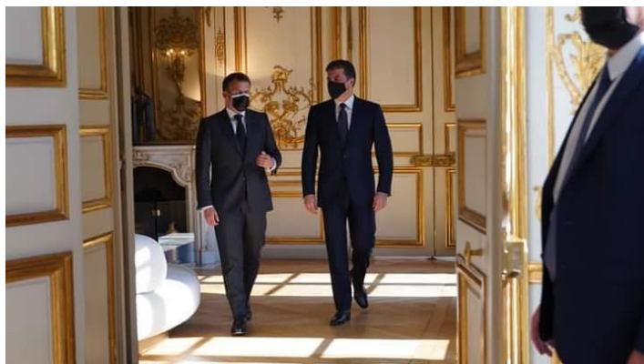
وینی ژمارە (3) (دەمی چونه دناڤ کۆچکا (ئیلیرابیس) ی)

3- شیوازی ب ریفە چونی: ل دەمی گەشتنا سەرۆکی هەریمی و هەر ژدەسپیکى هەتا چونا ئەوی بۆ کۆچکا (ئیلیرابیس) ی هەتا دناڤ کۆچکیریدا ئەگەر ئەم بنیرین، دی بئین بریفە چونهکا هیمن و هیدییه، ئەفە ژى واتایا هەبونا کەسایهتییهکا مەزن و سەرکەفتی و باوهریخوبونا سەرۆکی هەریمی ددەت وەکی سەرۆک و