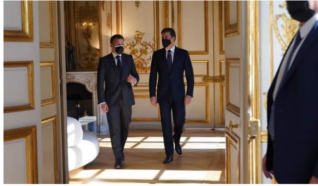
وینی ژماره (3) (دەمی چۆنە دناڤ کوچکا (ئێلیزابیسی) ی)

ل قیژی ئەگەر ئەم بنیڕینە ئاراستە و چەوانییا هەردو ملان بۆمە دیاردبیت، کو سەرۆکی هەریمی د بارەکی ئەرینی و ئاساییدایە، ئەو ژێ باوەریبخۆبون و راستگوییە، لەوا گرنگییی ب بەرامبەری ددەت.