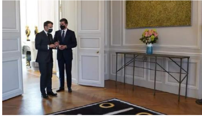
وینی ژماره (4) (دهمی چونه دناڤ کوچکا (ئیلزابیس) ی)