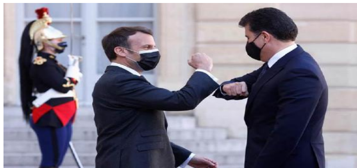
وینی ژماره (1) (دەمی پیشوازیی)

5- شیوازی سەرۆسیمایان: سەرۆکی فەرەنسا ل دەمی پیشوازی سەرۆکی هەرێما کوردستانی (نچیرقان بارزانی) دا، ب سەرۆ سیمایه کا گەش و ب گرنزینقە دیاردبیت، ژلایهکی دیقە سەرۆکی هەرێما کوردستانی ژێ ب هەمان شیوه ب سەرۆسیما و روخساره کا