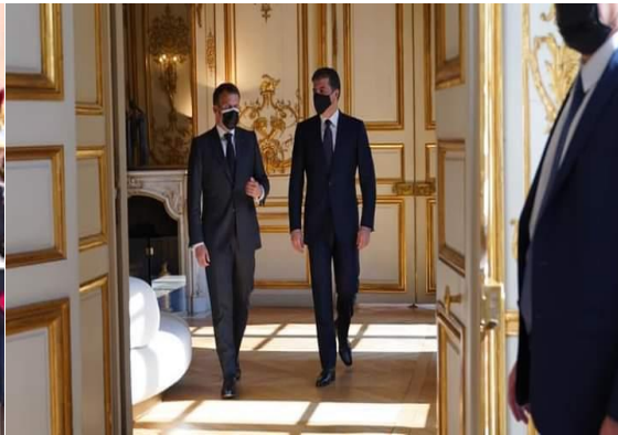
وينى ژماره (3)