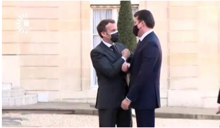
وینی ژمارە (2) (دەمی پيشوازیی)

2- شیوازی بکارهینانا چاقان و لئینیرینین راستەوخۆ بۆ ئیک و دو: دلسۆزی و راستگویییا ئەوان ددەت بەرامبەری ئیک و دو، وەکی د هەر ل دەمی هەفدیتنا ئەوان هەردو سەرۆکان ب نیرینەکا راستەوخۆ وینی ژمارە (2) دا دیار: و ب ئاراستەکا راستەو پاست دئیرنە ئیک و دو، ئەفە ژى واتایا