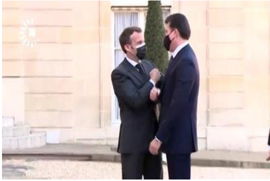
وینی ژماره (5) (دہمی خاتر خواستنی)