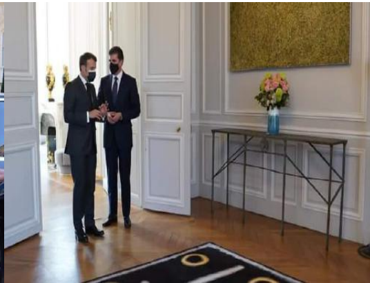
وینێ ژماره (4)

د وینێ ژماره (5) دا ئه‌گه‌ر ئه‌م بنێرینه شێوازی پاره‌ستیانا سه‌رۆکی هه‌ریما کوردستانی پشته‌ بدوماهیکه‌هاتنا کۆمبونا ئه‌وی دگه‌ل سه‌رۆکی ڤه‌ره‌نسا ل ده‌می خاتر خواستنییدا، دی دبینین پاره‌ستیانه‌کا پیکه‌ و پێیڤن ئه‌وی ب ئه‌ندزه‌یه‌کا گونجای ڤه‌کرینه، ئه‌ڤه‌ ژێ د زمانێ له‌شیدا واتایا هه‌بونا که‌سایه‌تییه‌کا سه‌رکه‌فتی و باوه‌ری و هیژ و شانازیکرێن و پازیبونه‌ ب ئه‌وی په‌یوه‌ندیی، هه‌روه‌سا سه‌رۆکی ڤه‌ره‌نسا ی ژێ ب هه‌ردو ده‌ستان ده‌ڤه‌را ده‌سپیکێ یا هچکێ نێزیککی ملی دگرت، ئه‌ڤه‌ چهنده‌ واتایا رێزگرتنه‌کا به‌یژه‌ به‌رامبه‌ری سه‌رۆکی هه‌ریما کوردستانی.