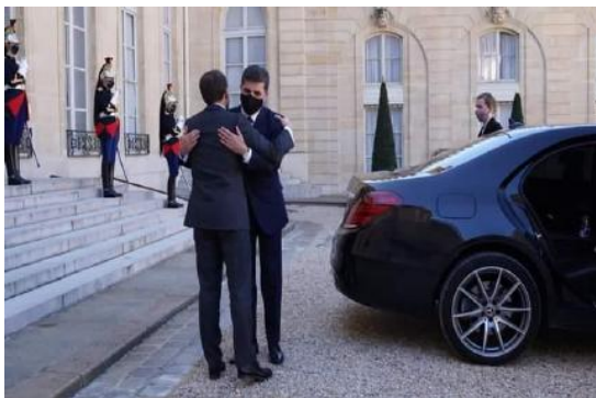
وینی ژماره (7) (دهمی خاترخواستنی)

9- واتا و ئاماژه‌یین پیزگرتنی ب پیکا ده‌ستلیدانا پشته و ده‌ستدانا سه‌ر ملی: ل دهمی خاترخواستنی‌دا سه‌روکی هه‌ریمی دهستی خو ل پشته سه‌روکی فه‌ره‌نسای ددهت وه‌کی ئاماژه‌یه‌کا پیزگرتنی، دیسان ل دهمی پیشوازیی زی دهستی خو ل نیفا ده‌ست (باسک، هچک) ی سه‌روکی فه‌ره‌نسای ددهت ئه‌ڤه ژ لایه‌کیڤه، ژ لایه‌کی دیڤه دهمی سه‌روکی فه‌ره‌نسای پیشوازی ل سه‌روکی هه‌ریما کوردستانی کری