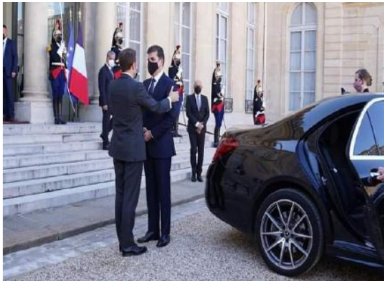
وینێ ژماره (5)

4- شێوازی پاره‌ستیانی: ل ده‌می ته‌ڤه‌کرێن و پێشوازیی هه‌تا کو ده‌می پاره‌ستیانا ل پێش کۆچکا (ئیلیزابیسی) و ته‌نانه‌ت ل ده‌می خاتر خواستنا سه‌رۆکی هه‌ریمی دگه‌ل سه‌رۆکی ڤه‌ره‌نسا (ماکروۆن) ی دبینین پاره‌ستیانه‌کا پێک و پیکه‌ و هه‌ردو پێ ژێ ب ئه‌ندانه‌یا هه‌ردو ملان هاتینه ڤه‌کرێن، ئه‌ڤه‌ چهنده‌ واتایا هیژ و کۆنترۆل و